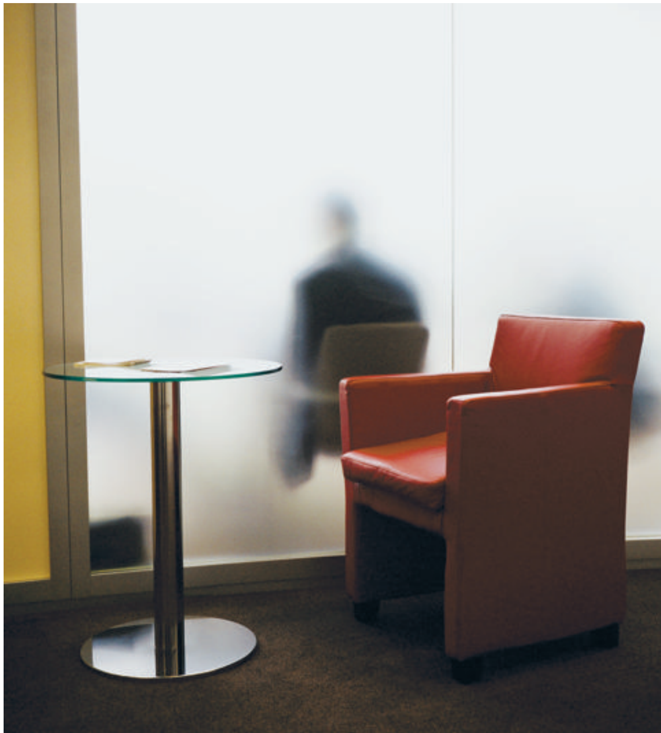
Confrontée au suicide d'un salarié, l'entreprise doit impérativement briser le silence.

Longtemps, chez les employeurs, le suicide est resté tabou. En témoigne ce manager d'une multinationale à la tête de sept commerciaux dont l'un s'est pendu en mai dernier : « Personne n'est venu à moi, ni les